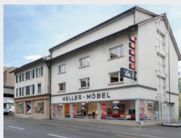
Ausstellung auf 5 Etagen