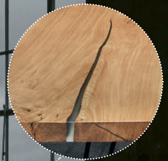
Detailansicht Esstischplatte mit Acryl-Füllung

IHR FAMILIENBETRIEB IN WOLHUSEN SEIT 1875